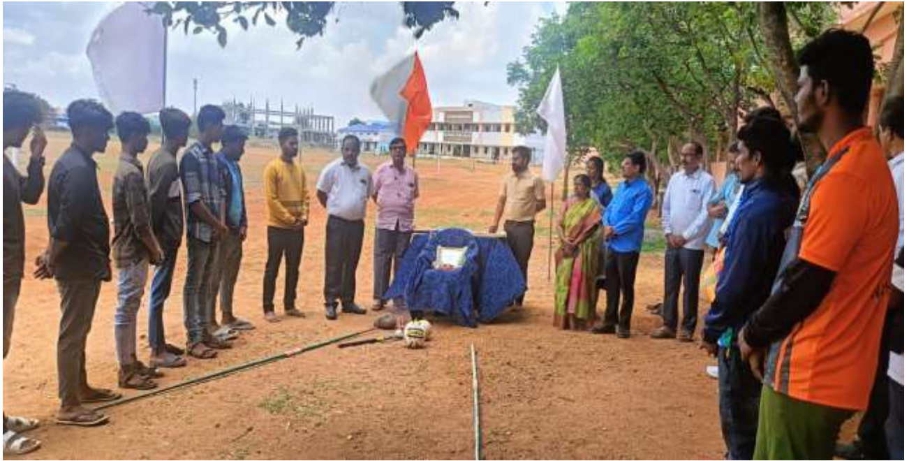
Observed National Sports Day