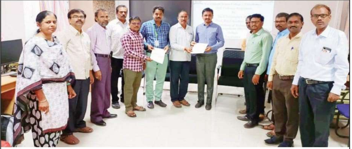
ఒప్పంద పత్రాలను మార్చుకొంటున్న అధికారులు

ప్రభుత్వ డిగ్రీ కళాశాల, బళ్లారి ఇన్స్టిట్యూట్ ఆఫ్ టెక్నాలజీ అండ్ మేనేజ్మెంట్ కళాశాలల మధ్య ఒప్పందం - పరిశోధనలు, ఇతరత్రా విషయాల్లో కొనసాగనున్న పరస్పర సహకారం