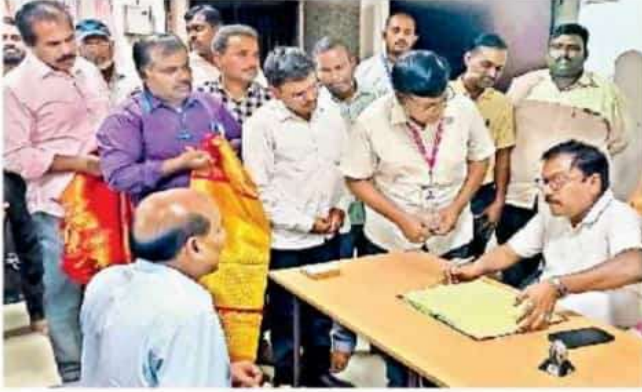
రికార్డులు పరిశీలిస్తున్న ఉన్నత విద్యా కమిషనర్ పోలా భాస్కర్