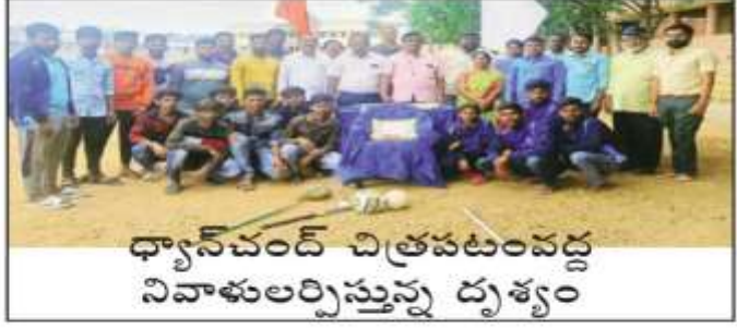
ధ్యాన్చంద్ చిత్రపటంవద్ద నివాళులర్పిస్తున్న దృశ్యం